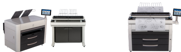
KIP 700C シリーズ カラー複合システム