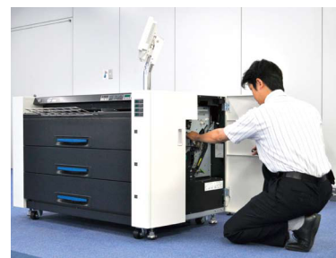
きめ細やかな保守・点検を行い、万一の故障にも技術スタッフが迅速に対応します。